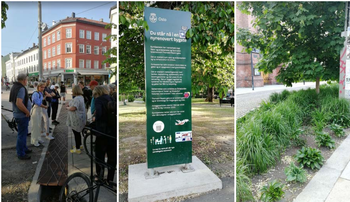
Befaring med focus på overvann i Thorvald Meyers gate.